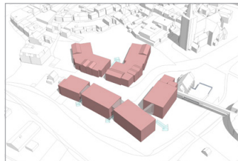
Gewenste nieuwe situatie